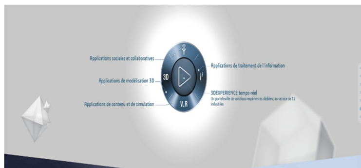
Figure 2 – Le PLM développé par Dassault Systèmes

Le PLM répond à l'objectif de maîtrise de la totalité des opérations d'élaboration de la valeur offerte au client. Il utilise pour cela toutes les technologies disponibles afin de rendre compatibles les bases de données relatives aux produits/services et aux méthodes. Le PLM se présente ainsi comme une méthode d'intégration des informations gérées par une ou plusieurs organisations afin de réduire les temps de collecte et de traitement de l'information. Il supporte donc la gestion de projet afin de réduire les temps de conception et de production (Paraponaris & alii., 2018). Désormais, les processus industriels de conception se déroulent massivement via des suites logicielles de conception numériques qui sont devenues indispensables pour la réalisation de la quasi-totalité des produits manufacturés. La diffusion de ces outils a été facilitée par la démocratisation des ordinateurs associée à l'accroissement de leurs performances (Bozdoc, 2004). « La puissance des suites de conception Product Lifecycle Management (PLM) et Product Data Management (PDM) permet de gérer numériquement des étapes clés telles que la conception d'usines, la commande de matière premières ou encore la gestion de la maintenance du produit au sein d'un unique environnement logiciel (Daloz, 2010, Tornincasa et Di Monaco, 2010) ».