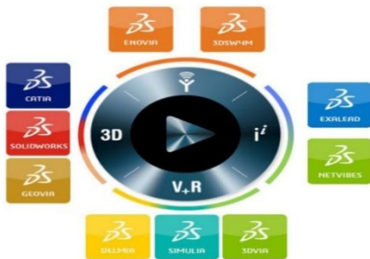
Figure 1 – L'offre logicielle de Dassault Systèmes

Dassault Systèmes assure sa forte croissance au cours des années 90 avec sa suite logicielle (plus de 10 systèmes) qui s'adresse à la totalité de l'industrie et une partie des services (figure 1). Cette offre consiste à mettre à disposition des moyens numériques pour aider ou faciliter : l'idée et la spécification du produit ; la conception grâce aux premiers modèles en 3D jusqu'à la réalisation de maquettes numériques complètes ; la simulation de l'utilisation des produits ; l'industrialisation virtuelle et la gestion des opérations de production ; la planification et l'optimisation des opérations ; le marketing numérique ; l'expérience d'achat des produits.